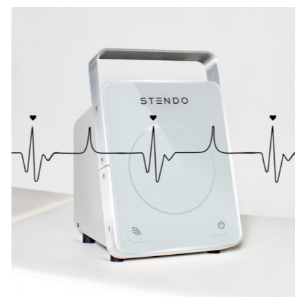
STENDO® V4: Das Steuergerät löst die kardial-synchronen Impulse aufgrund der Herzfrequenz aus, welche über einen Pulsoximeter gemessen und an die Manschette weitergeleitet werden.

Die STENDO® Pulstherapie ist aber nicht einfach nur ein neues oder anderes Lymphdrainage-Gerät. STENDO® kann viel mehr als nur Schlacken ausleiten. STENDO® erzeugt über künstliche Stimulation Scherkräfte und stimuliert so die Endothelzellen zur Produktion von Stickstoffmonoxid (NO). Durch den Stickstoffmonoxid-Transport werden Blut- und Lymphgefässe, analog einem «Reinigungsprozess», zum schnelleren Abbau von Stoffwechselabfällen erweitert, und dies wiederum führt zu einer verbesserten Nähr- und Sauerstoffversorgung des Gewebes.