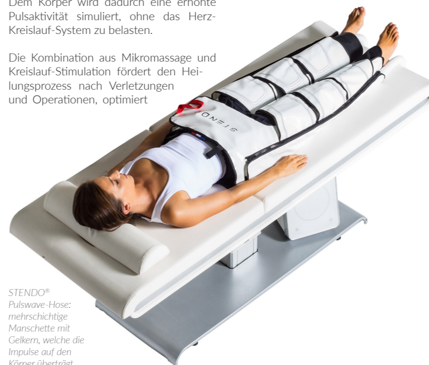
STENDO® Pulswave-Hose: mehrschichtige Manschette mit Gelkern, welche die Impulse auf den Körper überträgt.

Die Kombination aus Mikromassage und Kreislauf-Stimulation fördert den Heilungsprozess nach Verletzungen und Operationen, optimiert