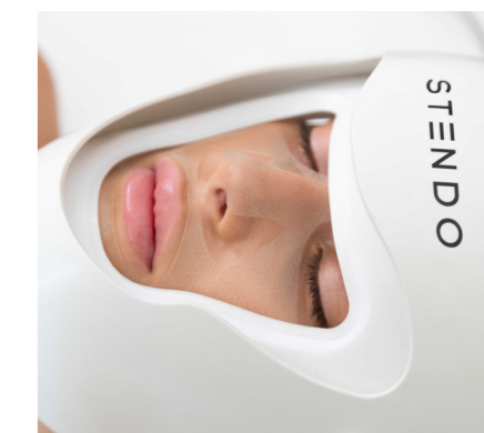
Die STENDO® Face-Maske mit gelgefülltem Kissen, überträgt die Impulse auf das Gesicht.

Mit dem STENDO® Face hat STENDO® Laboratoire eigens eine Gesichtsmaske mit Gelkissen entwickelt, welche während circa 30 Minuten auf das Gesicht eine Folge von pulsierenden Wellen appliziert, die ebenfalls in Echtzeit auf dem Herzrhythmus basieren. Das Ergebnis ist eine tiefgehende vaskuläre Verbesserung des Gesichts- und Dekolleté-Bereichs sowie eine Stimulation der Fibroblasten und ver-